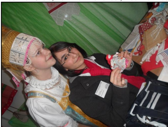
ÜFA meets Russland