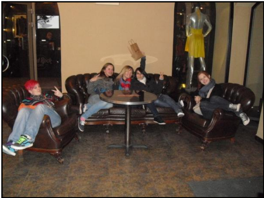
Der Besuch des Hard Rock Cafés ist ein MUSS!