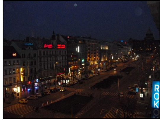
Wenzelsplatz bei Nacht