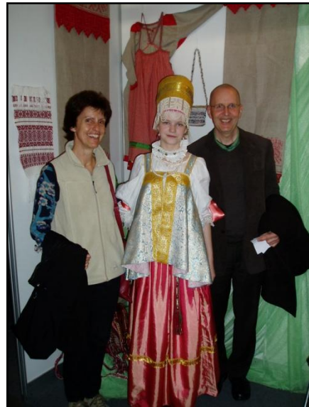
ÜFA meets Russland