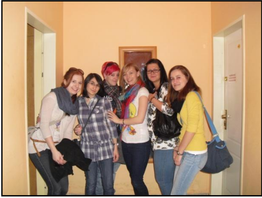
Mädchengruppe der 4EK – gerade angekommen in Prag