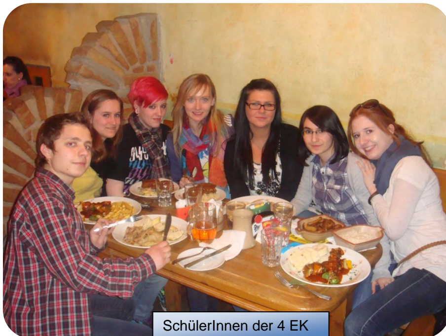
SchülerInnen der 4 EK

Nach der Führung hatten alle natürlich einen Bärenhunger. Wir aßen in einem tschechischen Restaurant, typisch tschechische Speisen. Für einige war das Essen zu scharf, aber trotzdem hat es uns geschmeckt.